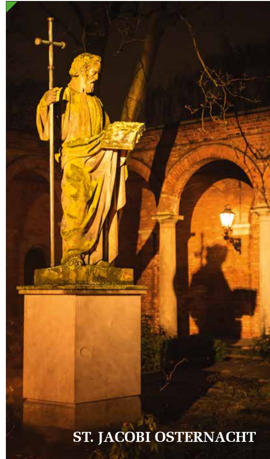
ST. JACOBI OSTERNACHT