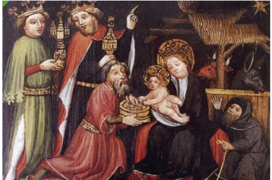
Anbetung der Könige, unbekannter Meister, um 1400; Evangelische Spitalstiftung Isny

Die eigentliche Weihnachtszeit beginnt mit dem Weihnachtstag und dauert bis zum 06. Januar, dem Tag der Erscheinung des Herrn, Epiphania, oder wie viele sagen: dem Fest der Heiligen Drei Könige. Die 12 heiligen Tage und Nächte sind in besonderer Weise dem Gedächtnis